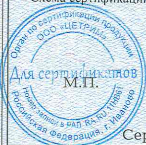
Схема сертификации: Ic